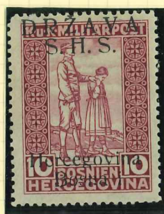
A20I Wording signed transposed