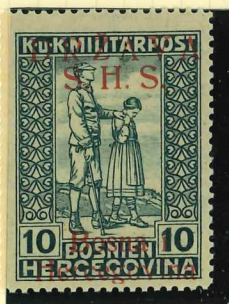
19I proof signed Certificate