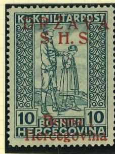
19I proof signed