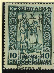
19I DD Certificate