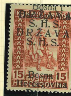
20I DD Certificate