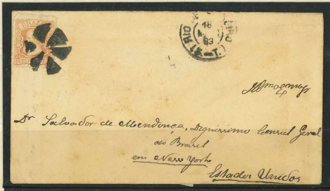
Carta do Rio de Janeiro dirigida ao Cônsul-Geral do Brasil em N.York, Salvador de Mendonça. Carimbo mudo, "Rio de Janeiro 18 ? 83" e no verso "NEW YORK JUN 12 PAID ALL"