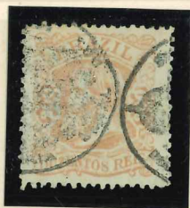
Carimbo oficial PA 1639