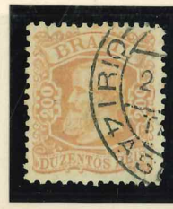
Rio de Janeiro 4a Seção, Tarde