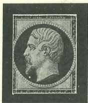
5 C. dunkelgrün dark green vert foncé s. vert