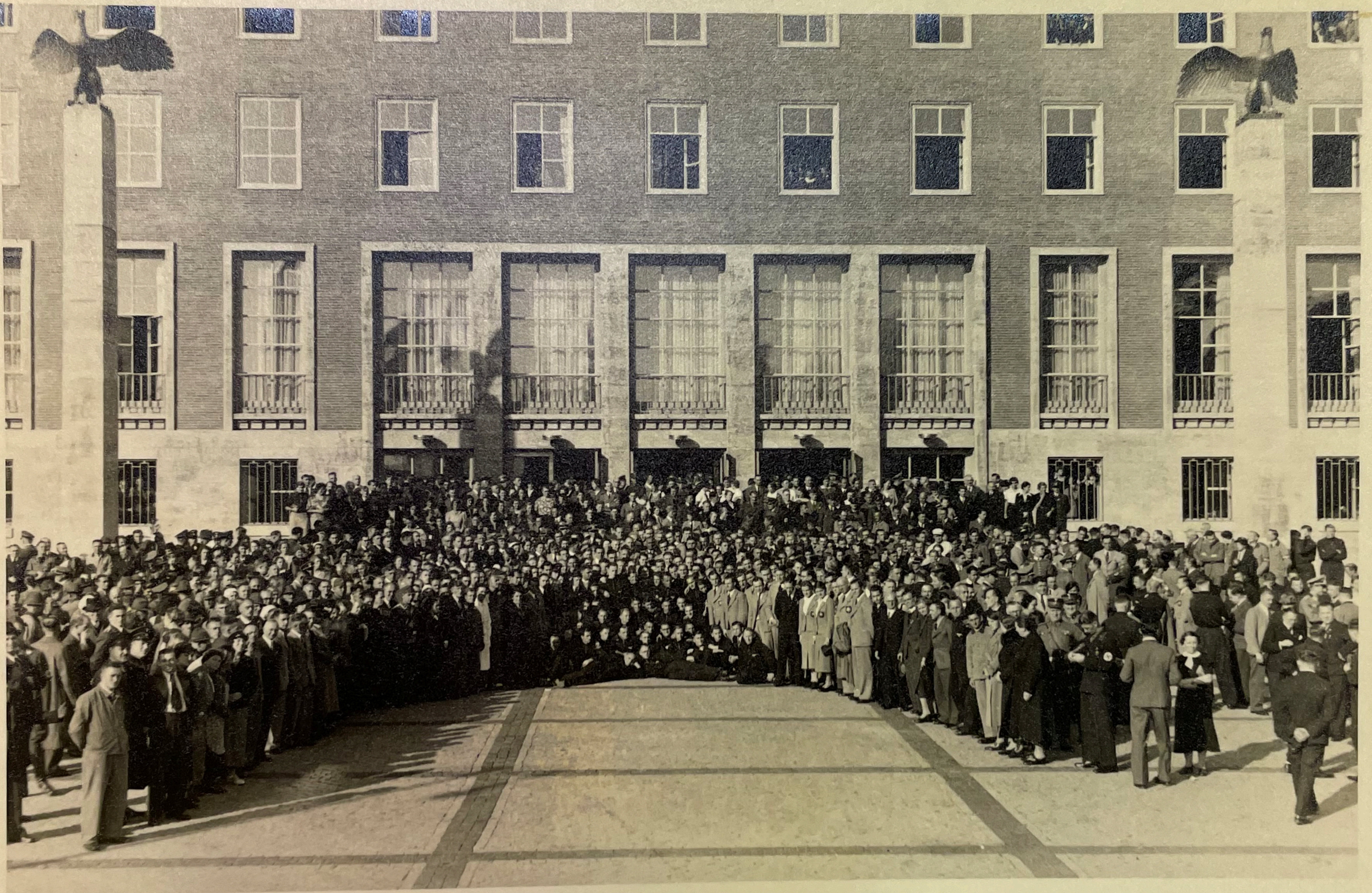
Am 25. Oktober vorm Haus des Deutschen Sports