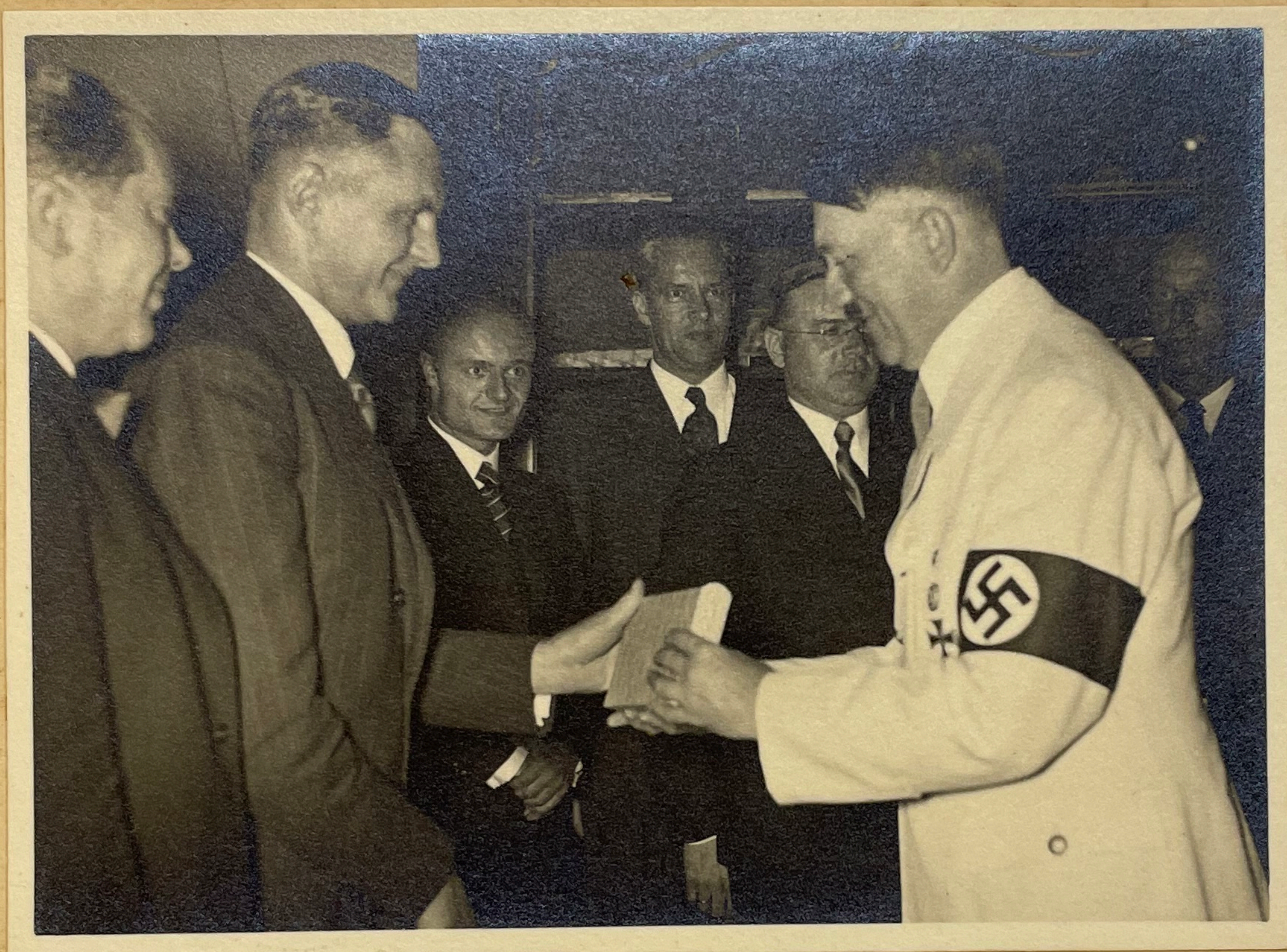
Die Sieger im Olympischen Kunstwettbewerb