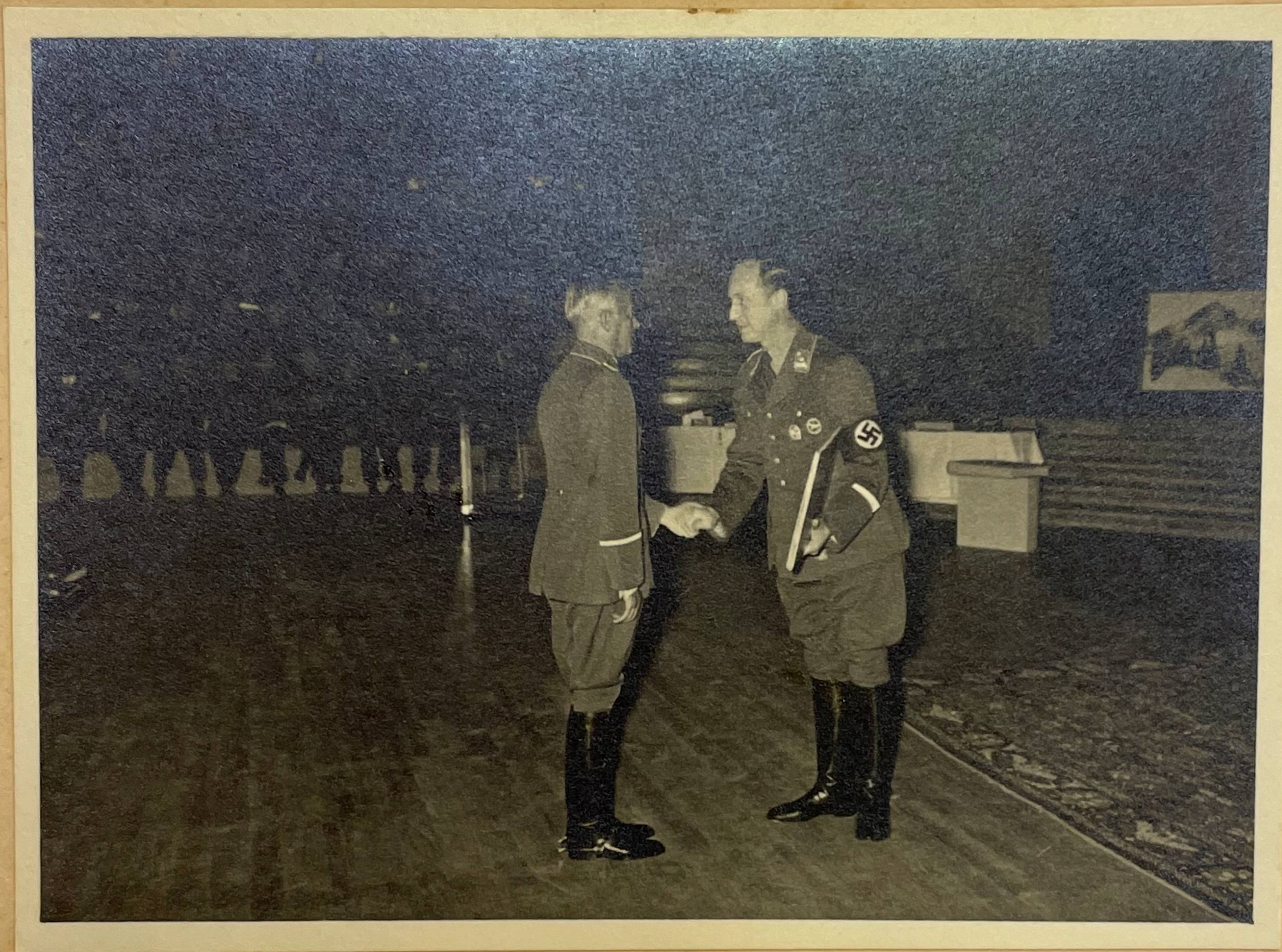
Der Stellvertreter des Reichsportführers überbringt die Glückwünsche des DRG