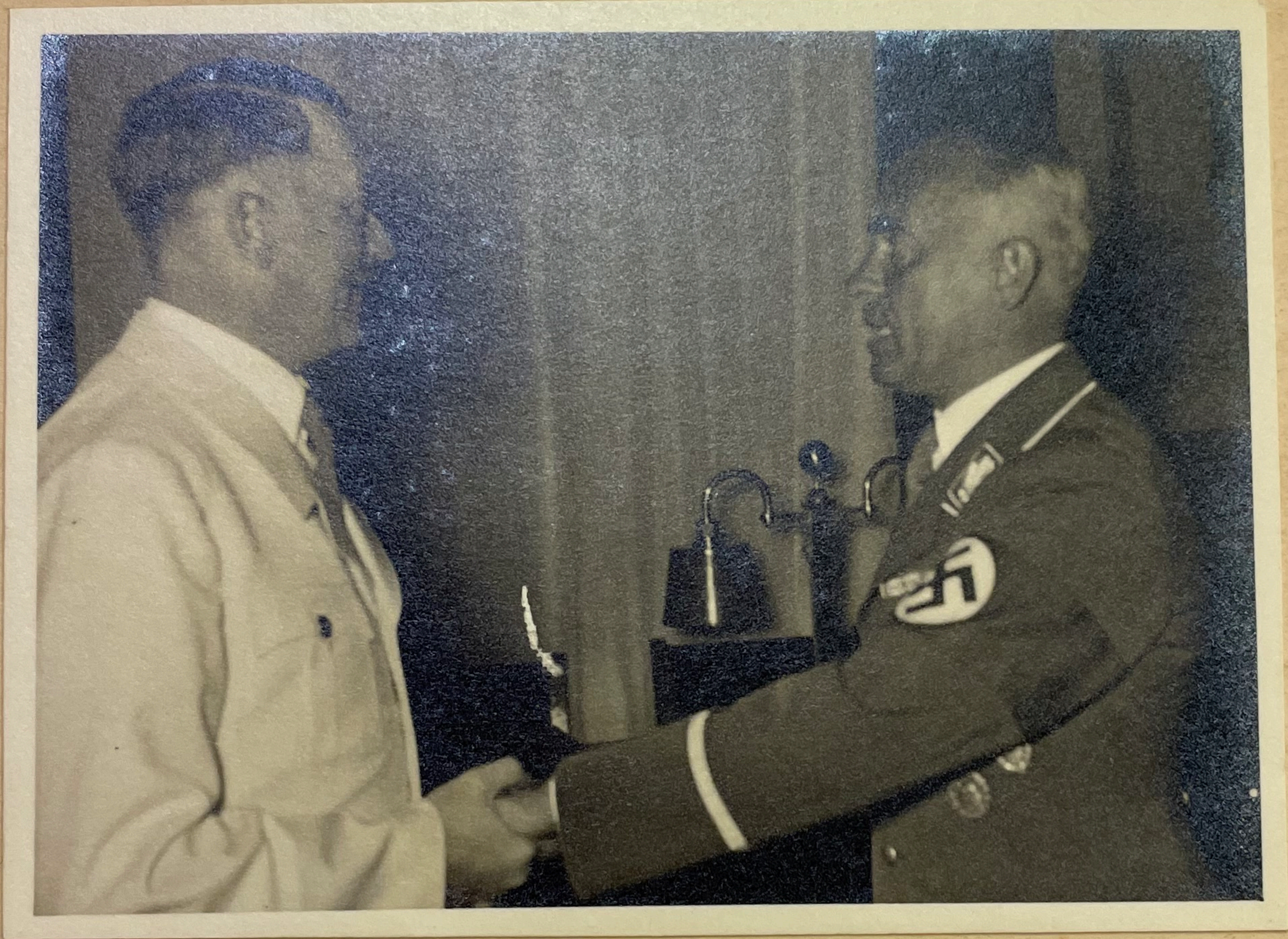
Der Führer gratuliert