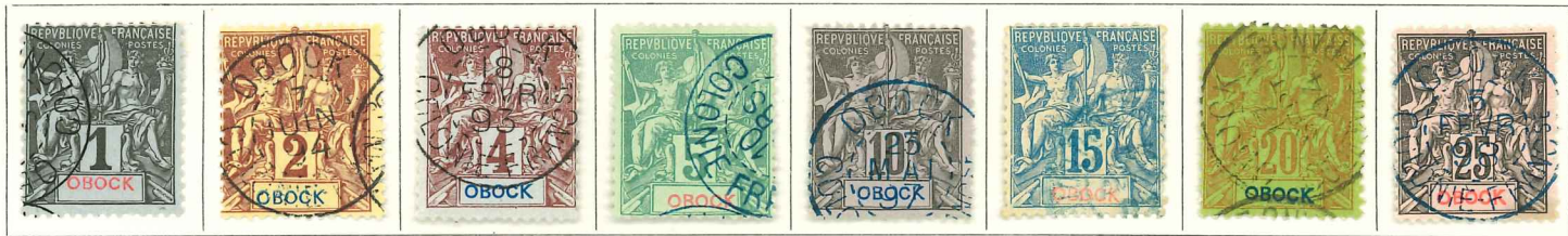
1892. — Groupe allégorique. OBOCK dans le cartouche du bas. Dentelés 14 x 13 1/2.