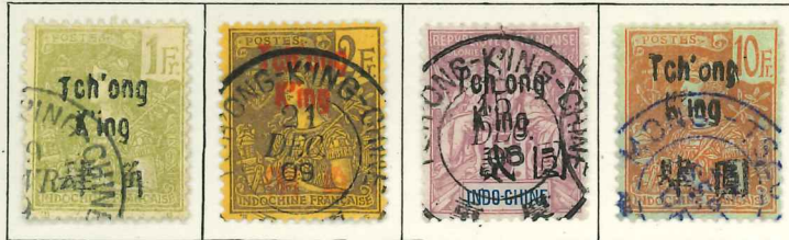
1908. — Timbres d'Indochine de 1907 (Centre noir) avec TCHONGKING et valeur et monnaie chinoise en surcharge.