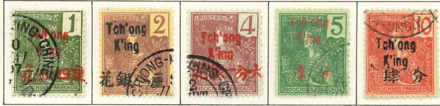
1906. — Timbres d'Indochine de 1892-1904 avec «Tch'ong K'ing» et valeur en monnaie chinoise en surcharge.