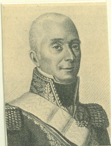
Le général comte Mathieu Dumas.