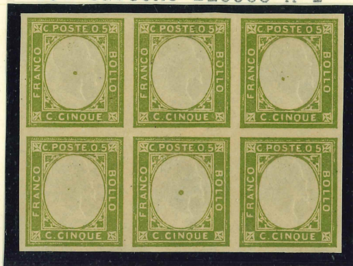
S.I Sassone Blocco n°1