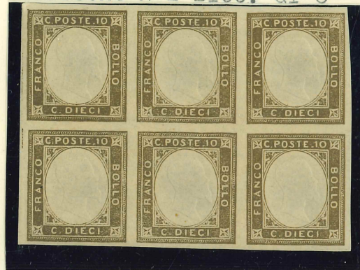
Sassone N°2 Bloc. di 6