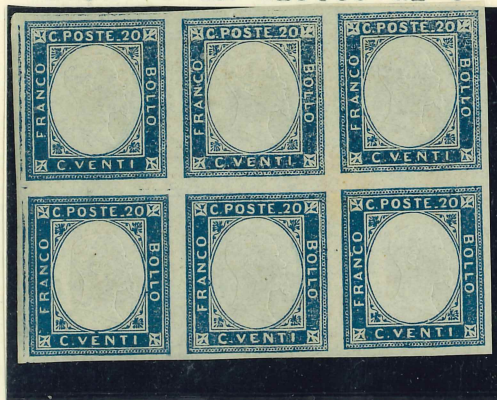
id.n° 3 in Blocco di 6