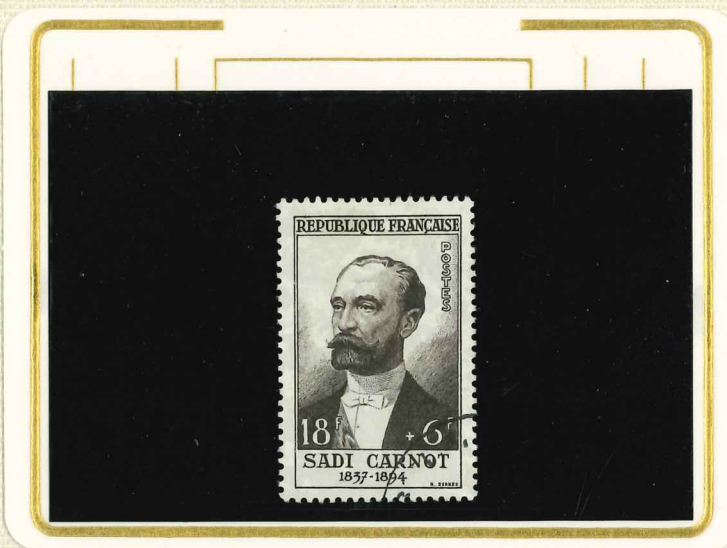
SADI CARNOT (1857-1894) PRÉSIDENT DE LA RÉPUBLIQUE