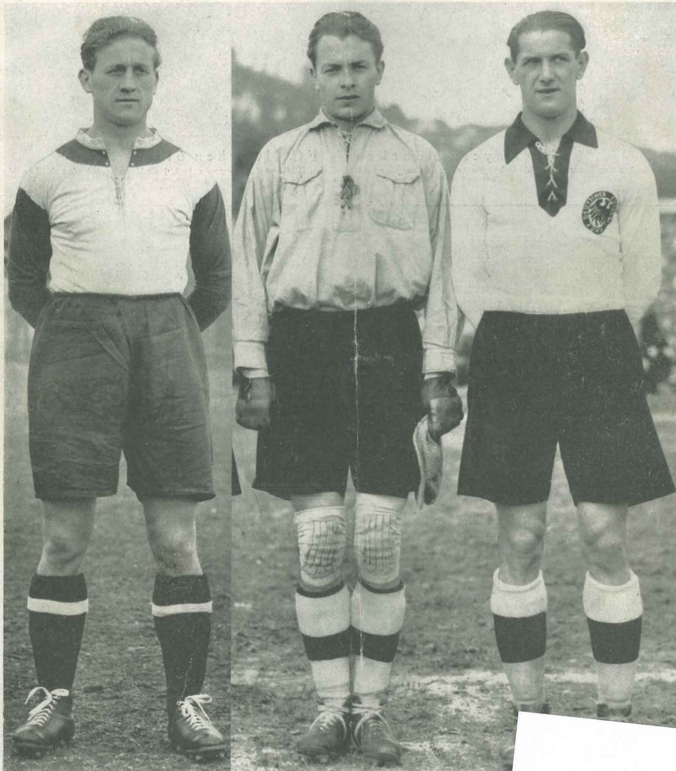
Deutschlands Verteidigung geg Haringer Kreß