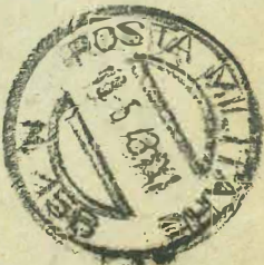
Fig. S. L.