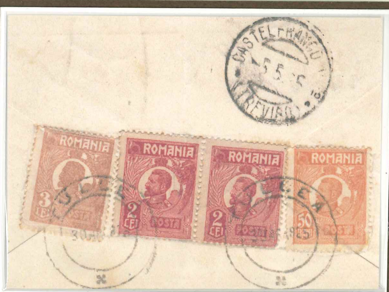
Lettera spedita in data 3.5.1926 da un componente italiano della Commissione Europea del Danubio dislocata a Tulcea (Romania). Come si può rilevare la corrispondenza della Commissione era soggetta al trattamento postale ordinario.