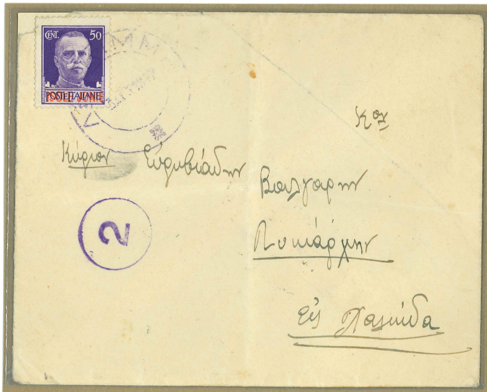
Bollo di colore violetto.