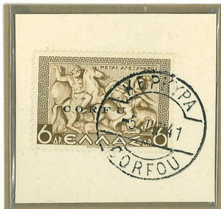
Bollo bilingue (greco-francese) "Kerkira-Corfou", normalmente usato sugli oggetti destinati all'estero.