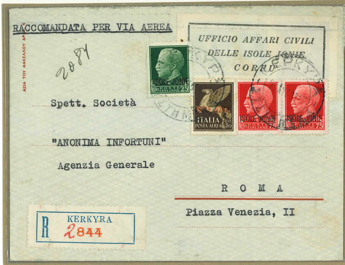
Bollo "Kerkira - Sistimena" normalmente usato per le raccomandate.