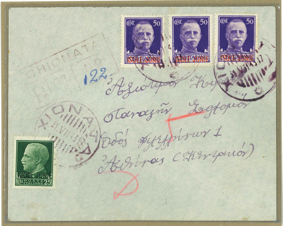
Bollo di colore viola