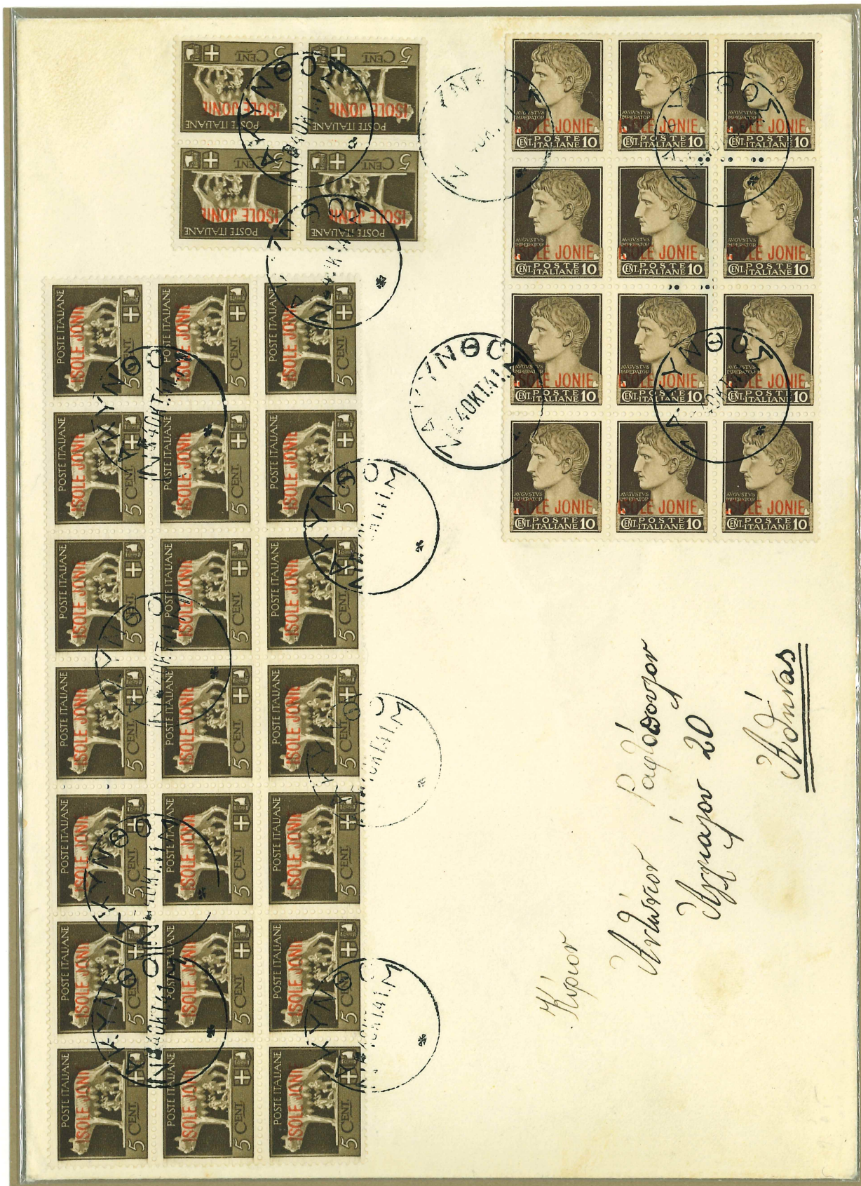
Bollo da 25 mm. ad un cerchio