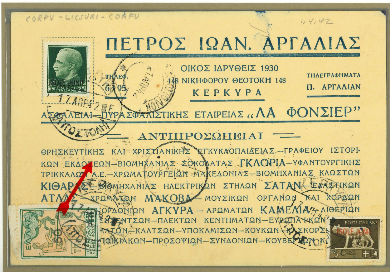
Bollo "Kerkira - Afixis" normalmente usato sulla corrispondenza in arrivo.