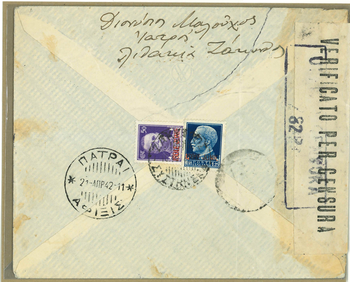
Bollo "Zakinthos - Sistimena" usato per le raccomandate