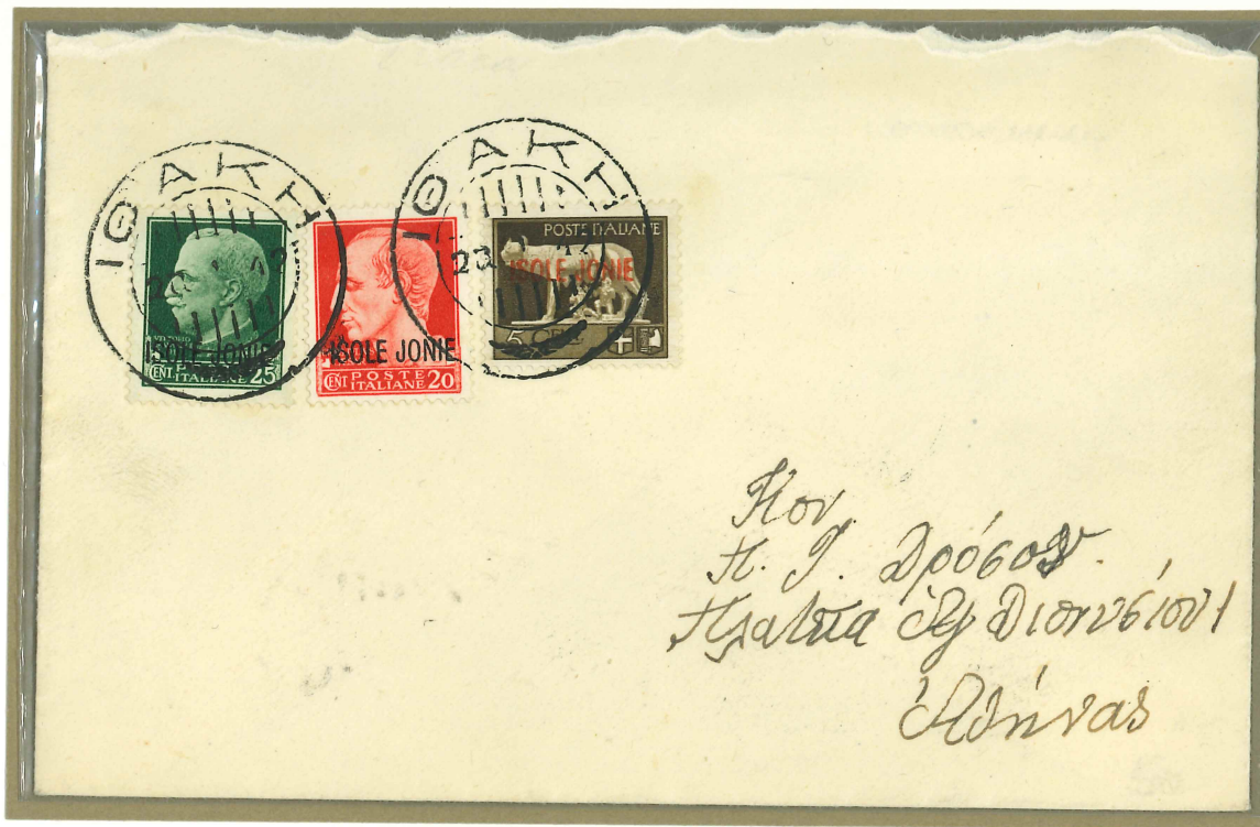
Bollo da 30 mm. di diametro con lunette tratteggiate.