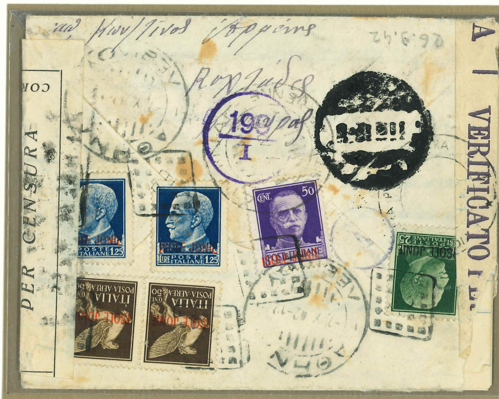
Bollo annullatore con datario e bollo in cartella per le raccomandate. Su questa lettera i francobolli sono al verso e sono annullati con il bollo a numero del procaccia. L'ufficio ha applicato i propri bolli allorchè ha preso in carico la lettera consegnata dal procaccia.