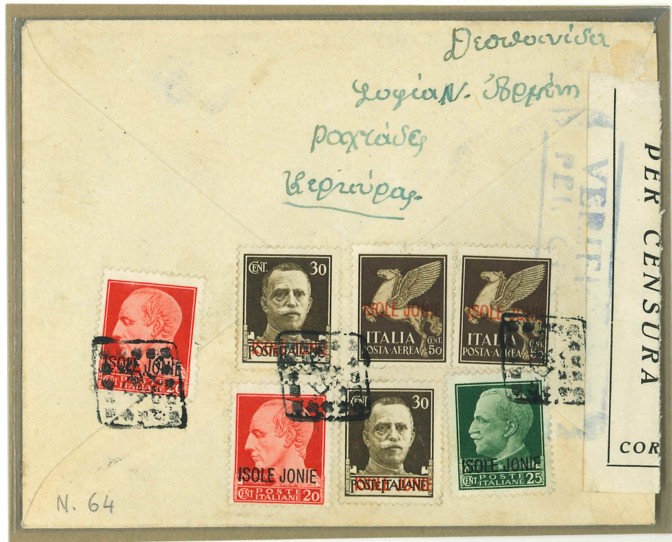
Due lettere con il bollo n. 64, entrambe indirizzate ad Atene via aerea. Sulla prima (in alto) l'affrancatura corrisponde ad una lettera ordinaria per l'interno mentre sulla seconda è quella di una raccomandata. Poi però quest'ultima non è stata presentata come tale all'ufficio di Karoussades; la lettera è stata pertanto inoltrata senza raccomandazione, per via aerea.