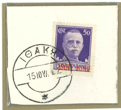
Bollo da 27 mm. di diametro con lunette vuote.