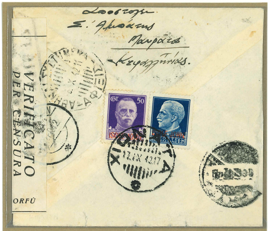
Bollo di colore nero