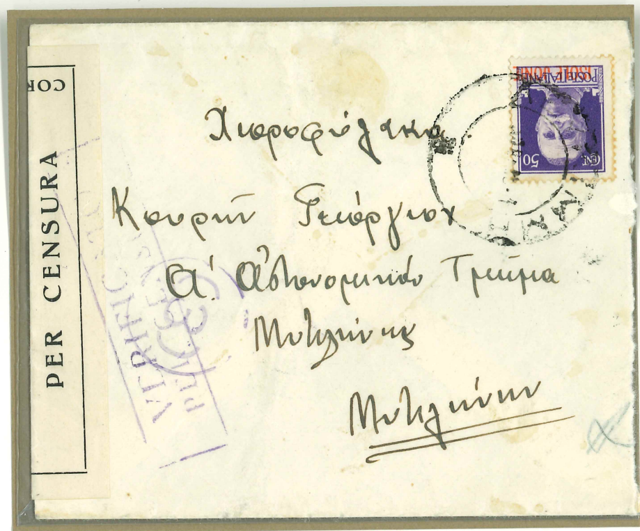
Bollo di colore nero