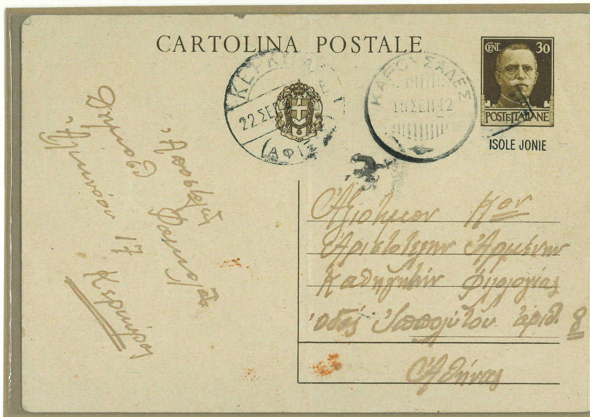
L'impronta di francobollo sulla cartolina è annullata con il bollo a numero del procaccia.