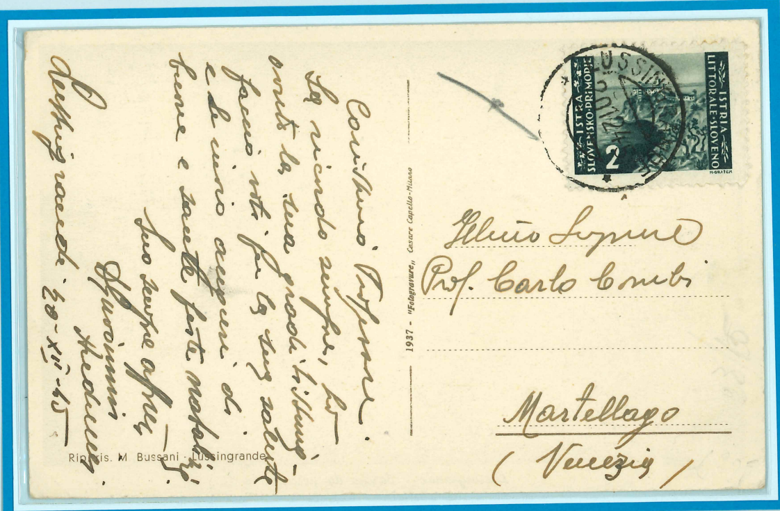
La prima e la seconda emissione denominata del "Litorale Sloveno" Una cartolina illustrata spedita da Lussingrande in data 20.12.1945 con il valore da L. 2 della prima emissione ed una lettera spedita da Capodistria in data 28.2.1946 con il valore da L. 4 della seconda emissione (nella prima emissione questo stesso valore è di colore oltremare). Nei bolli (ex italiani) il toponimo del capoluogo di provincia (Pola) è stato eliminato mediante scalpellatura.

Il 15.8.1945 fu messa in circolazione la prima emissione di francobolli di produzione jugoslava (stampata a Lubiana, con testo bilingue in italiano e sloveno) da usare in tutti i territori del cosiddetto "Litorale Sloveno". Di essa ci furono due tirature (la seconda, dal 11.2.1946) che differivano per la dentellatura e per il cambio di colore di alcuni valori. Nel frattempo, era anche iniziato il cambio dei bolli italiani, mediante sostituzione o scalpellatura del nome del capoluogo.