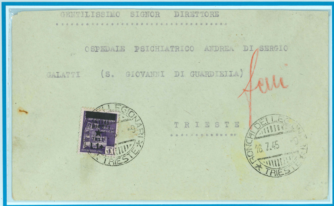
Il francobollo ex RSI da L. 1 soprastampato dagli iugoslavi, usato su lettera del 16.7.1945 spedita da Ronchi dei Legionari a Trieste. Ultimo giorno di validità di questa emissione.