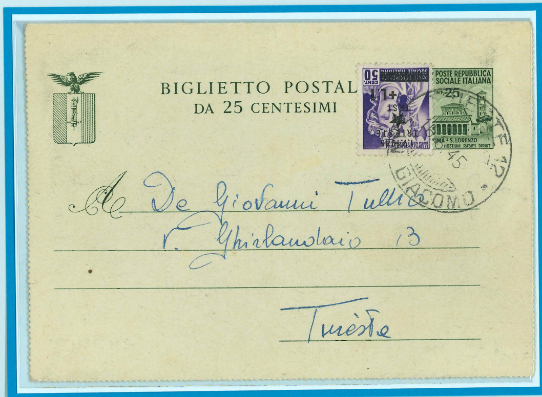
Il francobollo ex RSI da c. 50 soprastampato dagli iugoslavi ed usato su un biglietto postale RSI da c. 25 spedito da Trieste per città in data 16.6.1945 (al verso bollo di arrivo in data 17.6.1945). In questo caso il biglietto fungeva solo da supporto (tariffa distretto).

I francobolli soprastampati per la zona di Trieste furono messi in circolazione il 12.6.1945.