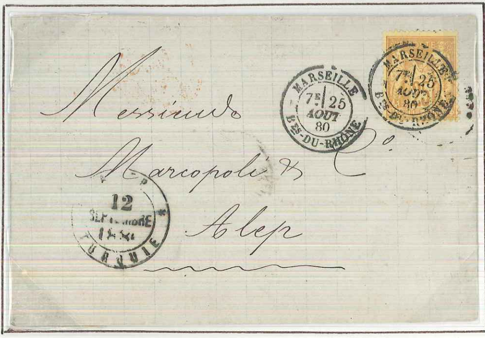
Tarif du 01.04.1879, 1er échelon de poids, 0 à 15g. = 25c.

La malle des Indes est le nom de la liaison postale mise en place par les autorités du Royaume Uni entre Londres et Bombay pour faire arriver les dépêches officielles à destination avec le minimum de temps. En 1870, la guerre franco-prussienne suspend en France le passage de la malle des Indes qui reprend en 1872 de Paris à Modane et Brindisi par chemin de fer.