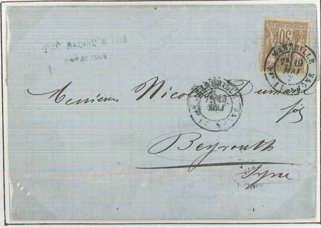
Tarif du 01.01.1876, 1er échelon de poids 0 à 15g. = 30c.

Dès 1516, les Ottomans s'emparent de la Syrie qu'ils conservent jusqu'en 1919. En 1845, la France crée le Bureau de Beyrouth pour faire face à la carence des postes locales et de répondre aux demandes des entreprises et commerçants français installés dans les ports du Moyen Orient.