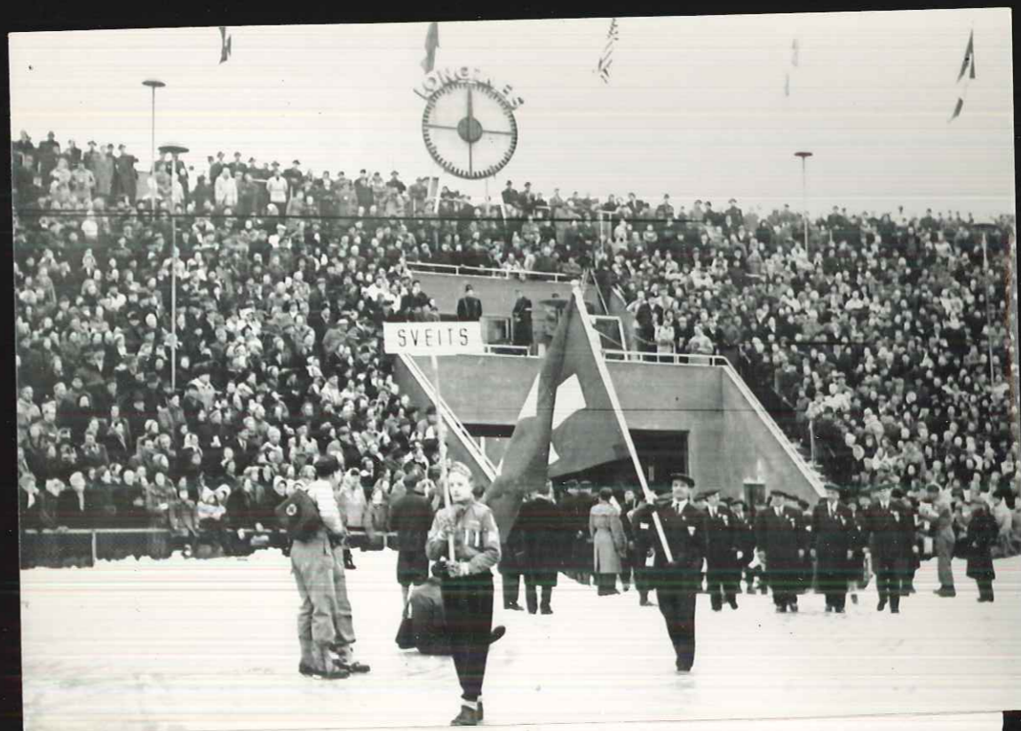
6. Olympische Winterspiele Oslo 1952.

Eröffnungszeremonie im Bislet-Stadion von Oslo. Einzug der Schweizerdelegation mit Uli Poltera an der Spitze.