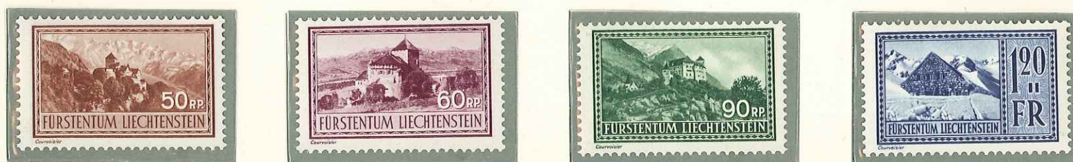
1934 - VEDUTE - VUES - VIEWS - LANDSCHAFTEN - DENT. 11 1/2.