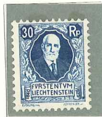
1925 - 85° ANNIV. DEL PRINCIPE GIOVANNI II - 85° ANNIV. DU PRINCE JEAN II - 85 th BIRTHDAY OF PRINCE JOHN - 85. GEBURTSTAG DES FURSTEN JOHANN II - DENT. 11 3/4.