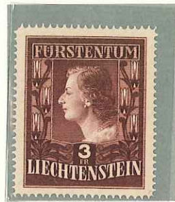
1951 - PRINCIPI - PRINCES - PRINCES - FURSTENPAAR - DENT. 12 1/2 x 12 o 15.