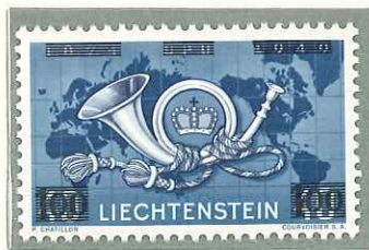
1950 - N. 242 SOPRASTAMPA- TO - TIMBRE DE 1949 SURCHAR- GE - STAMP OF 1949 OVERPRIN- TED - AUSHILFSMARKE.

POSTA ORDINARIA TIMBRES-POSTE POSTAGE STAMPS FREIMARKEN