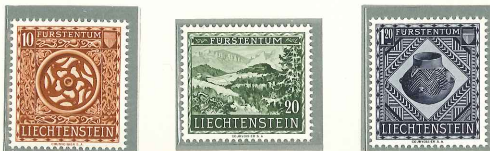
1953 - APERTURA DEL MUSEO NAZIONALE DI VADUZ - OUVERTURE DU MUSEE NATIONAL DE VADUZ - OPENING OF NATIONAL MUSEUM VADUZ - PRAEHISTORISCHE FUNDE - DENT. 11 1/2.