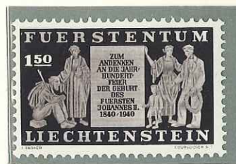
1940 - CENT. DELLA NASCITA DEL PRINCIPE GIOVANNI II - CENT. DE LA NAISSANCE DU PRINCE JEAN II - CENT. OF BIRTH OF PRINCE JOHN II - GEDENKMARKEN ZUM 100. GEBURTSTAG DES FURSTEN JOHANN II - DENT. 11 1/2.