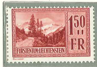
1935 - VEDUTE - VUES - VIEWS - LANDSCHAFTEN - DENT. 11 1/2.