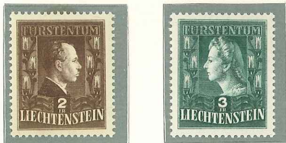
1944 - PRINCIPI - PRINCES - PRINCES FURSTENPAAR - DENT 12.

POSTA ORDINARIA TIMBRES-POSTE POSTAGE STAMPS FREIMARKEN