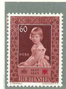
1955 - X ANNIV. DELLA CROCE ROSSA LOCALE - Xe ANNIV. DE LA CROIX ROUGE NATIONALE. - TENTH ANNIV. OF LIECHTENSTEIN RED CROSS - ZEHN JAHRE LIECHTENSTEINISCHES ROTES KREUZ - DENT. 11 1/2.