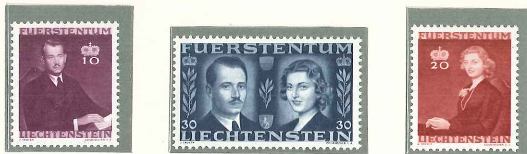
1943 - NOZZE DEL PRINCIPE - MARIAGE DU PRINCE REGNANT - MARRIAGE OF PRINCE - GEDENKMARKEN ZUR HOCHZEIT DES FUERSTEN - DENT. 11 1/2.