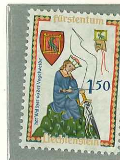
1961 - MENESTRELLI - LES "MINNESINGER" - MINNESINGERS - MINESANGER - DENT. II 1/2.