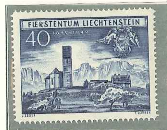
1949 - 250° ANNIV. DELL'ANNESSIONE DI SCHELLENBERG. - 250° ANNIV. DE L'ACQUISITION DE SCHELLENBERG - 250th OF FOUNDING OF LIECHTENSTEIN - 250 JAHRE ERWERBUNG DES UNTERLANDES