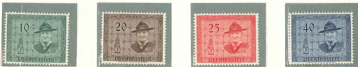
1953 - XIV CONFERENZA INTERN. DELLO SCOUTISMO A VADUZ - EN L'HONNEUR DU SCOUTISME - FOURTEENTH INTERNATIONAL SCOUT CONFERENCE - INTERNATIONALE PFADFINDERFUEHRER - KONFERENZ - DENT. 13 1/2.