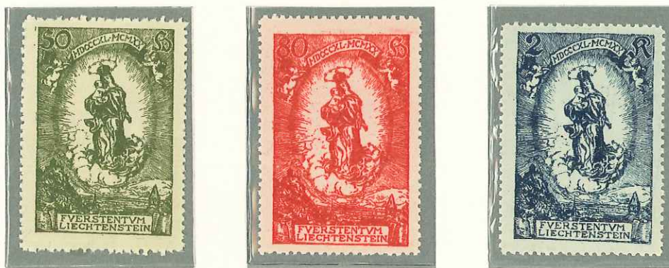
1920 - 80° ANNIV. DEL PRINCIPE GIOVANNI II - 80° ANNIV. DU PRINCE JEAN II - PRINCE'S 80 th BIRTHDAY - GEDENKMÄRKEN ZUM 80. GEBURSTAG DES FUERSTEN - DENT. 12 1/2.