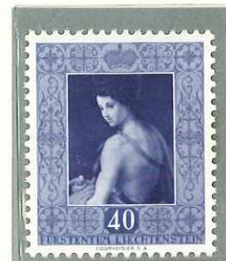
1952 - OPERE DELLA GALLERIA D'ARTE DEL PRINCIPATO - TABLEAUX DE LA GALERIE DE LA PRINCPAUTE - VARIOUS PAINTINGS FROM PRINCE'S COLLECTION FURSTLICHE GEMALDEGALERIE - DENT. 11 1/2.