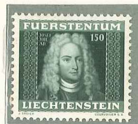
1941 - I SERIE DEI PRINCIPI - 1er SERIE DITE DES PRINCES - PORTRAITS OF VARIOUS PRINCES - LIECHTENSTEINS FURSTEN - DENT. 11 1/2.