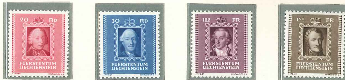
1942 - II SERIE DEI PRINCIPI - 2 e SERIE DITE DES PRINCES - PORTRAITS OF VARIOUS PRINCES - LIECHTENSTEINS FUERSTEN - DENT. 11 1/2.

POSTA ORDINARIA TIMBRES-POSTE POSTAGE STAMPS FREIMARKEN