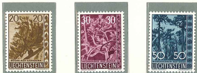
1960 - IV SERIE ALBERI ED ARBUSTI - ARBRES ET ARBUSTES (4e SERIE) - LIECHTENSTEIN TREES AND BUSHES - HEIMATLICHE BAUME UND STRAUCHER DENT. 11 1/2.