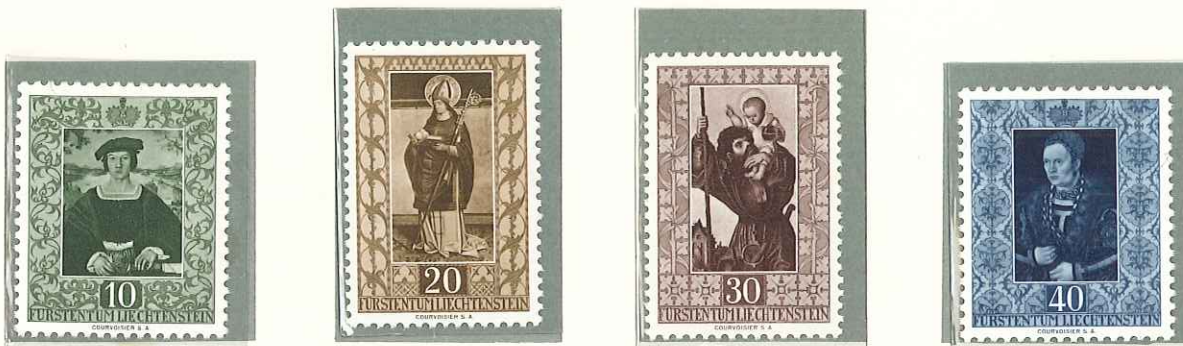
1953 - OPERE D'ARTE DELLA GALLERIA DEL PRINCIPATO - TABLEUX DE LA GALERIE DE LA PRINCIPAUTE - VARIOUS PAINTINGS FROM PRINCE'S COLLECTION - FURSTLICHE GEMALDEGALERIE - DENT. 11 1/2.