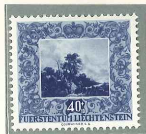
1951 - PRO OPERA DI BENEFICENZA - AU PROFIT DES OEUVRES DE BIENFAISANCE - CHARITY - WOHLTATIGKEITS - DENT 11 1/2.