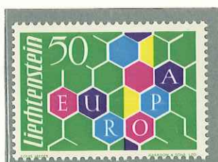
1960 - IDEA EUROPEA - EMISSION EUROPEENNE - EUROPA ISSUE - SONDER- MARKE "EUROPA" - DENT. 13 1/2 x 14.