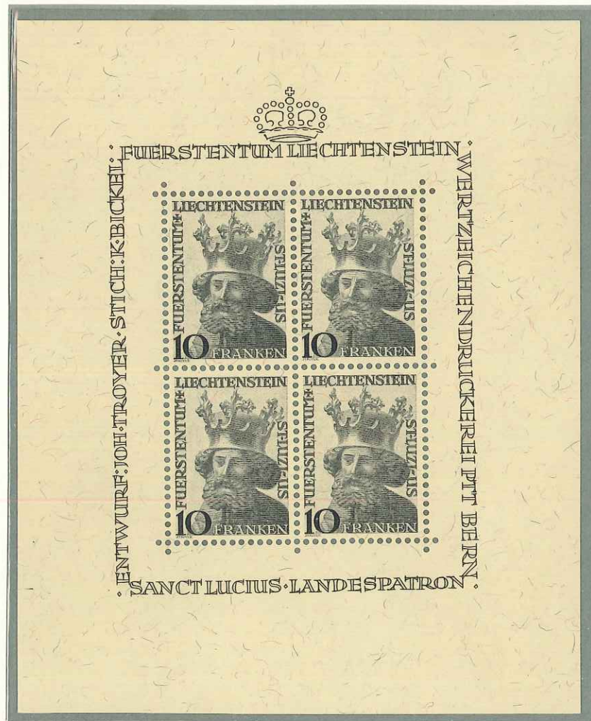
1946 - SAN LUCIO - ST. LUCIEN - ST. LUCIUS - ST. LUZIUS - DENT. 12x11 1/2.