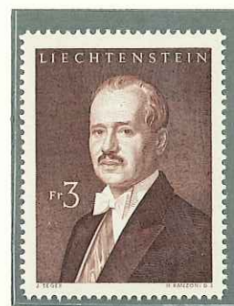
1959 - 1964 - PRINCIPI - PRINCES - PRINCES - FURSTEN PAAR - DENT. 11 1/2.