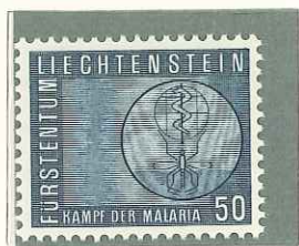
1962 - LOTTA CONTRO LA MALARIA - ERADICATION DU PALUDISME - CAM- PAIGN AGAINST MALA- RIA - KAMPF GEGEN DIE MALARIA - □ 11 1/2.