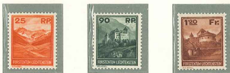
1933 - VEDUTE - VUES - VIEWS - LANDSCHAFTEN - DENT. 14 1/2.