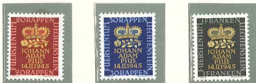
1945 - NASCITA DEL PRINCIPE EREDITARIO GIOVANNI ADAMO PIO - NAISSANCE DU PRINCE JEAN-ADAM - BIRTH OF CROWN PRINCE JOHN ADAM PIUS - GEDENKMARKEN ZUR GEBURT DES ERBPRINEN - DENT. 12.