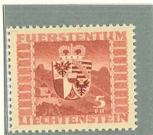
1947 - STEMMA - AR- MOIRE - ARM. - WAPPEN - DENT. 11 1/2.