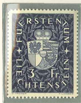
1939 - STEMMI - ARMOIRIES - ARMS - WAPPEN - DENT. 12.