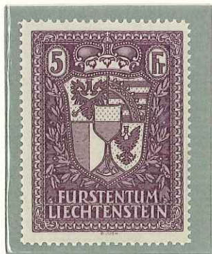
1935 - TIPO DEL N. 122 - TYPE DE 1934 - TYPE OF 1934 - WAPPEN DENT. 12 1/2.

POSTA ORDINARIA TIMBRES-POSTE POSTAGE STAMPS FREIMARKEN