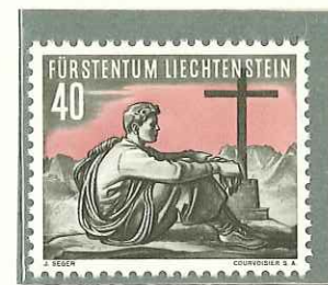
1955 - II SERIE SPORTIVA. SPORT DI MONTAGNA - IIe SERIE SPORTIVE - SPORT - BERGSPOET - DENT. 11 1/2.