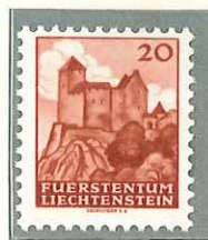
1943 - VEDUTE - VUES - WIEWS - LANDSCHAFTEN - DENT. 11 1/2.