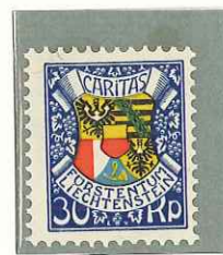
1927 - 87° ANNIV. DEL PRINCIPE GIOVANNI II - 87° ANNIV. DU PRINCE JEAN II - 87 th BIRTHDAY OF PRINCE JOHN - 87. GEBURTSTAG DES FURSTEN JOHANN II - DENT. 11 1/2.