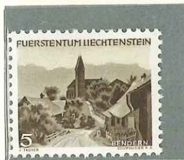
1949 - VEDUTA - VUE - VIEW - LANDSCHAFTEN - DENT. 12.