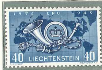
1949 - 75° ANNIV. DELL'U.P.U. - 75 ANNIV. DE L'U.P.U. - 75th ANNIV. OF FOUNDING OF U.P.U. - 75 JAHRE WELTPOSTVEREIN - DENT. 11 1/2.