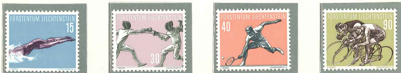
1958 - V SERIE SPORTIVA - 5e SERIE SPORTIVE - SPORT - SPORT - DENT. 11 1/2.