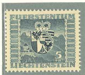
1945 - STEMMA - AR- MOIRE - ARM - WAPPEN - DENT. 11 1/2.