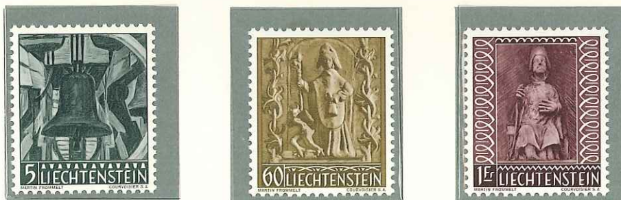
1959 - SERIE DI NATALE - TIMBRES DE NOËL - CHRISTMAS - WEIHNACHTS- MARKEN - DENT. 11 1/2 x 12.

POSTA ORDINARIA TIMBRES-POSTE POSTAGE STAMPS FREIMARKEN