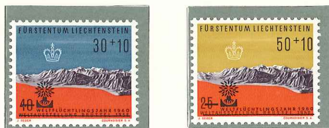
1960 - ANNO MONDIALE DEL RIFUGIATO - ANNEE MONDIALE DU REFUGIE - WORLD REFUGEE YEAR - WELTFLUECHTLING- SILFHE - DENT. 11 1/2.