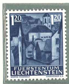
1962 - NATALE - TIMBRES DE NOËL - CHRISTMAS ISSUE - WEIHNACHTSMARKEN - □ 11 1/2.