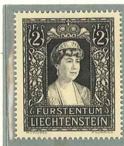
1947 - TIPO DEL 1935 - TYPE DE 1935 - TYPE OF 1935 - TRAUER- MARKE ZUM TODE DER FÜRSTIN-WITWE ELSA - DENT. 14 1/2.