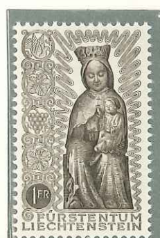
1954 - CHIUSURA DELL'ANNO MARIANO - CLOTURE DE L'ANNEE MARIALE TERMINATION OF MARIAN YEAR - MARIANISCHES JAHR - DENT. 11 1/2.