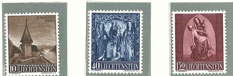
1957 - SERIE DI NATALE - TIMBRES DE NOEL - CHRISTMAS - WEIHNACHT- SMARKEN - DENT. 11 1/2.