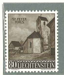
1958 - SERIE DI NATALE - TIMBRES DE NOEL - CHRISTMAS - WEIHNACHT- SMARKEN - DENT. 11 1/2.