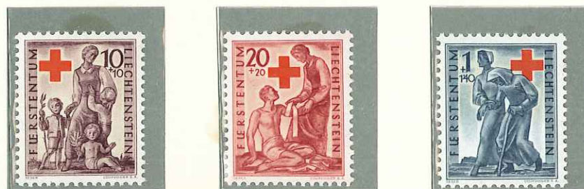
1945 - PRO CROCE ROSSA - POUR LA CROIX ROUGE - RED CROSS - SONDERMARKEN FUR DAS ROTE KREUZ - DENT. 11 1/2.