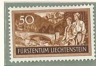
1937 - CANTIERI PER COMBATTERE LA DISOCCUPAZIONE - COM. DES TRAVAUX ENTREPRIS POUR COMBATTRE LE CHOMAGE - WORKER'S ISSUE - 10 JAHRE ARBEITSBESCHAFFUNG - DEN. 11 1/2.