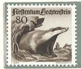
1950 - FAUNA LOCALE (TERZA SERIE) - FAUNE LOCALE - WILDLIFE - WILDLIBENDE TIERE - DENT. 11 1/2.