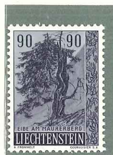
1958 - II SERIE ALBERI ED ARBUSTI - ARBRES ET ARBUSTES (2e SERIE) - LIECHTENSTEIN TREES AND BUSHES - HEIMATLICHE BAUME UND STRAUCHER DENT. 11 1/2.