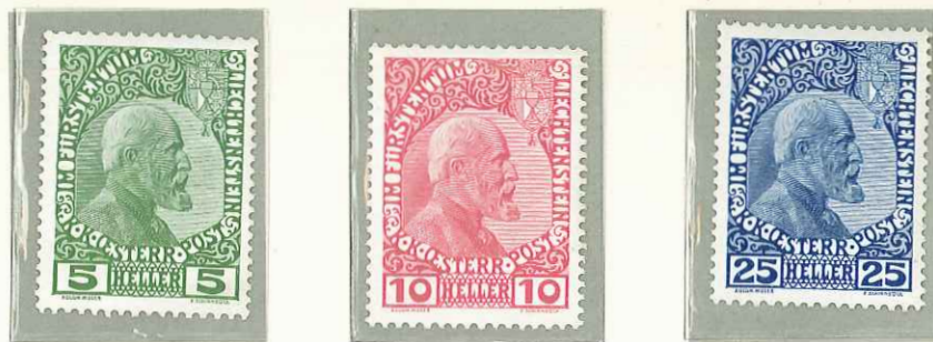
1912 - EFFIGIE DEL PRINCIPE GIOVANNI II - EFFIGIE DU PRINCE JEAN II - PRINCE JOHN II - FUERST JOHANN II - DENT. 12 1/2.

POSTA ORDINARIA TIMBRES-POSTE POSTAGE STAMPS FREIMARKEN