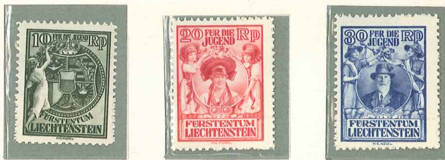
1932 - PRO INFANZIA - EMIS AU PROFIT DES OEUVRES DE L'ENFANCE - CHARITY STAMPS - WOHLFAHRTSMARKEN FUER DIE JUGEND - DENT. 11 1/2.

POSTA ORDINARIA TIMBRES-POSTE POSTAGE STAMPS FREIMARKEN