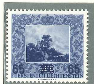
1954 - Nn. 263/265 SOPRASTAMPATI - TIMBRES DE 1951 SURCHARGES - STAMPS OF 1951 OVERPRINTED - AUFBRAUCHSAUSGABE