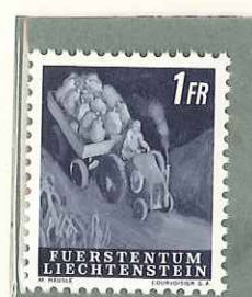
1951 - ATTIVITA' CONTADINE - SERIE PAYSANNE - FOOD PRODUCTION - AUS DEM LEBEN DES LANDMANN'S - DENT.12 1/2.