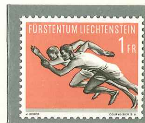
1956 - III SERIE SPORTIVA. ATLETICA - IIIe SERIE SPORTIVE - SPORT - LEICHTATHLETIK - DENT. 11 1/2.