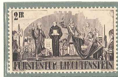
1942 - VI CENT. DELLA SEPARAZIONE DEL TERRITORIO DEL LIECHTENSTEIN DALLA CASA DEI CONTI DI MONTFORT - 6c CENT. DE LA SEPARATION DU TERRITOIRE DU LIECHTENSTEIN DE LA MAISON DES COMTES DE MONTFORT - 600th ANNIV. OF SEPARATION FROM ESTATE OF MONTFORT - 600 JAHRE TRENNUNG LIECHTENSTEINS VON MONFORT - DENT. 11 1/2.