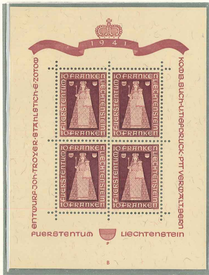
1941 - MADONNA DI DUX - MADONE DE DUX - MADONNA OF DUX - MADONNA VON DUX - DENT. 11 1/2.