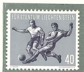
1954 - I SERIE SPORTIVA. CALCIO - Ière SERIE SPORTIVE (FOOT-BALL) - FOOT-BALL - FUSSBALL - DENT. 11 1/2.