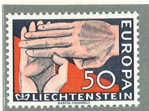
1962 - IDEA, EUROPEA - EMISSION EUROPEENNE - EU- ROPA ISSUE - SONDERMARKE "EUROPA" - □ 11.

POSTA ORDINARIA TIMBRES-POSTE POSTAGE STAMPS FREIMARKEN