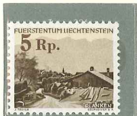
1949 - SOPRASTAMPA IN BRUNO SUL N. 199 - TIMBRE DE 1944 AVEC SURCHARGE BRUNE - STAMP OF 1944 SURCHARGE - AUSHILFS-MARKE

POSTA ORDINARIA TIMBRES-POSTE POSTAGE STAMPS FREIMARKEN