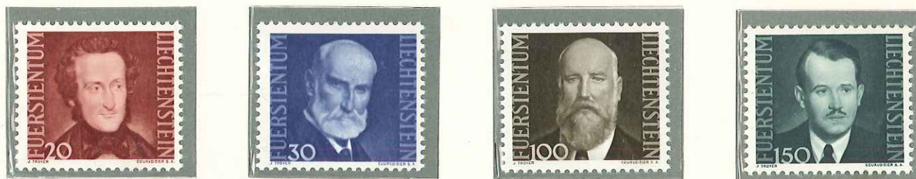
1943 - III SERIE DEI PRINCIPI - 3 e SERIE DITE DES PRINCES - PORTRAITS OF VARIOUS PRINCES - LIECHTENSTEINS FUERSTEN - DENT. 11 1/2.