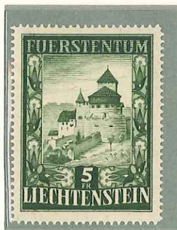
1952 - VEDUTA - VUE WIEW - LANDSCHAFTEN DENT. 14 1/2.

POSTA ORDINARIA TIMBRES-POSTE POSTAGE STAMPS FREIMARKEN