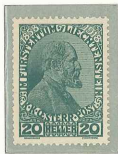
1918 - 60 e ANNIV. DEL PRINCIPE - 60 e ANNIV. DE L'AVENEMENT DU PRINCE JEAN II - 60 th ANNIVERSARY OF PRINCE JOHN' ACCESSION - 60 JAEHRIGES REGIERUGSJUBILAEUM JOHANNIS II - DENT. 12 1/2.