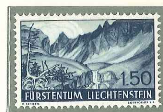
1937 - 1938 - VEDUTE - VUES - VIEWS - LANDSCHAFTEN - DEN. 12.