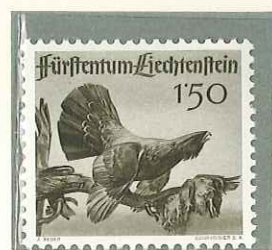
1946 - FAUNA LOCALE (PRIMA SERIE) - FAUNE LOCALE - WILDLIFE - WILDLEBENDE TIERE - DENT. 11 1/2.