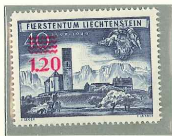
1952 - SOPRASTAMPA ROSA SUL N. 244 - TIMBRE DE 1949 SURCH - STAMP OF 1949 OVERPRINTED - AUSHILFSMARKE.