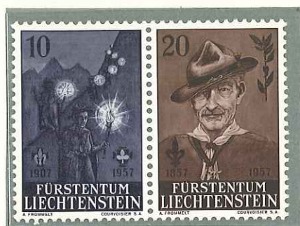
1957 - CINQUANTENARIO DELLO SCOUTISMO E CENT. DELLA NASCITA DI LORD BADEN POWEL - CINQUANTENAIRE DU SCOUTISME - 50 th ANNIV. OF BOY SCOUT MOVEMENT - 50. JAHRE PFAD- FINDER