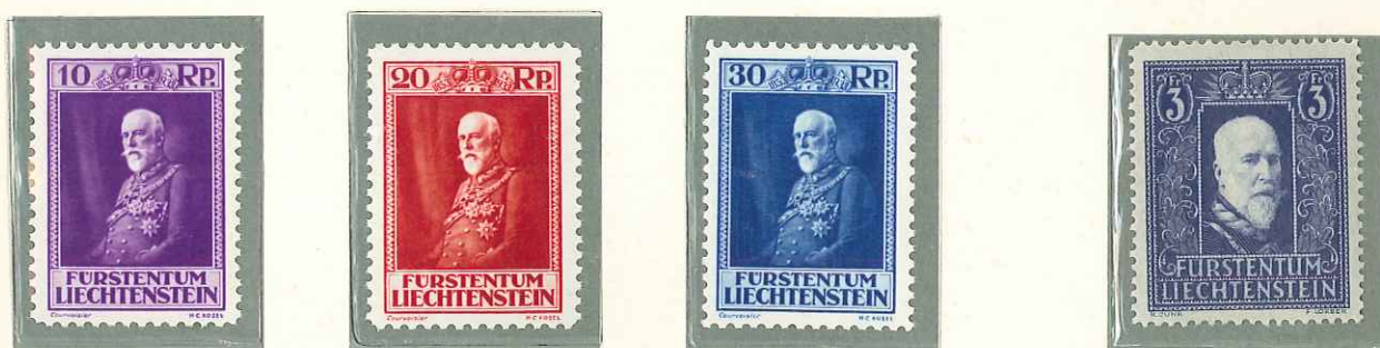
1933 - 80° GENETLIACO DI FRANCESCO I - 80° ANNIV. DU PRINCE FRANCOIS Ier - PRINCE'S FRANCIS 80 th BIRTHDAY - GEDENKMAREN ZUM 80. GEBURTSTAG DES FURSTEN FANZ I - DENT. 11.