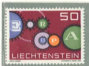
1961 - IDEA EUROPEA - EMISSION EUROPEENNE - EUROPA ISSUE - SONDER- MARKE "EUROPA" - DENT. II.