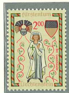
1962 - MENESTRELLI - LES "MINNESINGER" - MINNESINGERS - MINESÄNGER - □ 11 1/2.