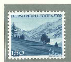
1944 - VEDUTE - VUES - VIEWS - LANDSCHAFTEN - DENT. 12