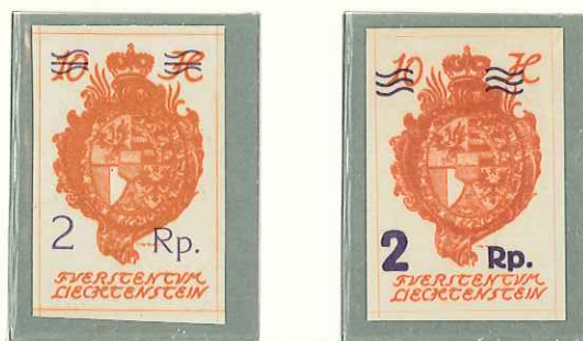
1921 - SOPRASTAMPA VIOLETTA SUL N. 18 - TIM. DE 1920 AVEC SURCH. VIOL. - STAMP OF 1920 SURCH. IN VIOLET - AUSHILFSAUAGABE MIT NEUEM WERTAUFD RUCK.