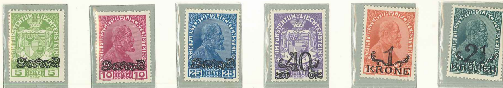
1920 - SOPRASTAMPA SUI TIPI PRECEDENTI - TIMBRES DE 1917-1918 SURCHARGES - STAMPS OF 1917-1918 OVERPRINTED - AUFBRAUCHSAUSGABE MIT ARABESKEN ODER NEUEM WERTAUFDRUCK - DENT. 12 1/2.