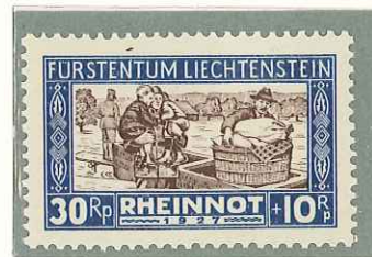
1928 - PRO VITTIME INONDAZIONE DEL RENO - EN FAVEUR DES VICTIMES DU DEBORDEMENT DU RHIN - FLOOD RELIEF STAMPS - WOHLTAETIGKEITSMARKEN FUER HOCHWASSERGESCHAEDIGTE - DENT. 11 1/2.