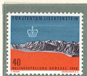
1958 - ESPOSIZIONE INTERNAZIONALE DI BRUXELLES - EXPOSITION DE BRUXELLES - BRUSSELS INTERNATIONAL EXHIBITION - BRUSSELER WELTAUSSTELLUNG - DENT. 11 1/2.