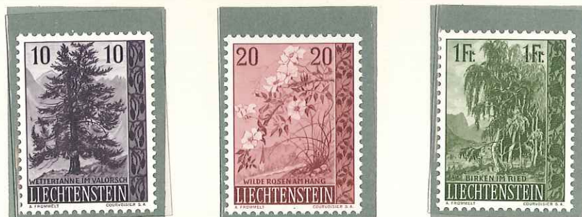
1957 - I SERIE ALBERI ED ARBUSTI - ARBRES ET ARBUSTES (1er SERIE) LIECHTENSTEIN TREES AND BUSHES - HEIMATLICHE BAUME UND STRAUCHER DENT. 11 1/2.

POSTA ORDINARIA TIMBRES-POSTE POSTAGE STAMPS FREIMARKEN