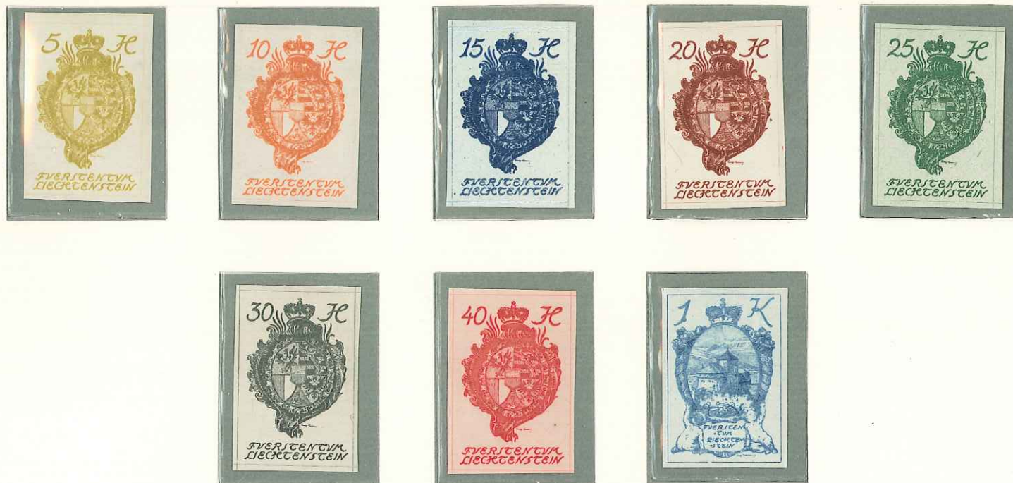
1920 - SERIE ORDINARIA - SERIE ORDINAIRE - ORDINARY SERIES - WAPPEN UND SCHLOSS VADUZ.

POSTA ORDINARIA TIMBRES-POSTE POSTAGE STAMPS FREIMARKEN