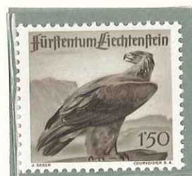
1946 - FAUNA LOCALE (SECONDA SERIE) - FAUNE LOCALE - WILDLIFE - WILDLEBENDE TIERE - DENT. 11 1/2.