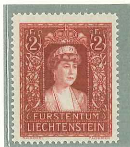
1935 - PRINCES- SA ELSA - PRINCESSE ELSA - PRINCESS ELSA - FUERSTIN ELSE DENT. 12 1/2.