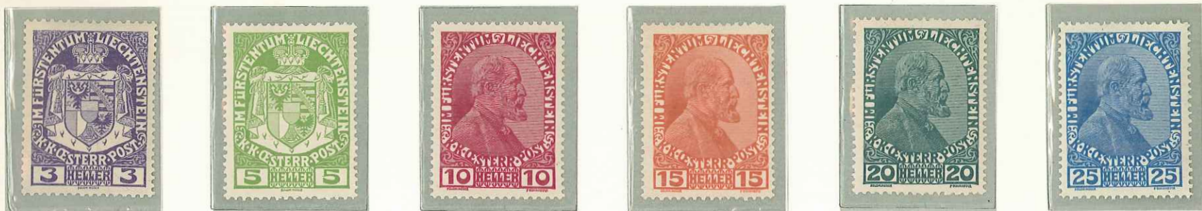
1917 - STEMMA OD EFFIGIE DEL PRINCIPE GIOVANNI II - EFFIGIE DU PRINCE JEAN II - PRINCE JOHN II - FUERST JOHANN II - DENT. 12 1/2.