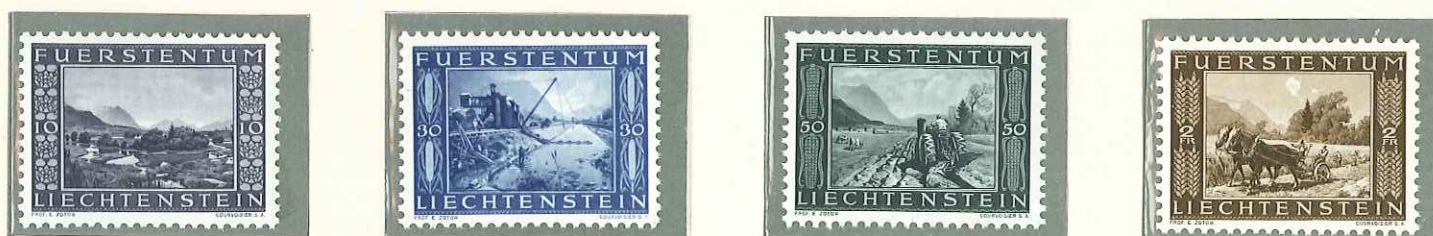
1943 - COMPLETAMENTO DEL CANALE INTERIORE - ACHÈVEMENT DU CANAL INTERIEUR - COMPLETION OF IRRIGATION CANAL - GEDENKMARKEN ZUR BEENDIGUNG DES KANALBAUS - DENT. 11 1/2.