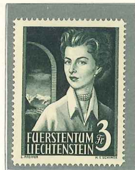
1955 - PRINCIPI - PRINCES - PRINCES - FUERSTEN- PAAR - DENT. 14 1/2.