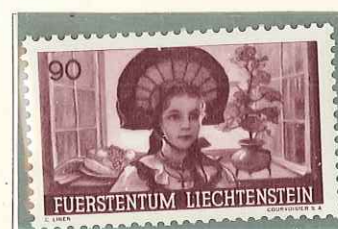
1941 - PROPAGANDA PER L'AGRICOLTURA - PROPAGANDE POUR L'AGRICULTURE - AGRICULTURAL PROPAGANDA - WERBEMARKEN FUR HEIMISCHE ANBAUFORDERUNG - DENT. 12 1/2.